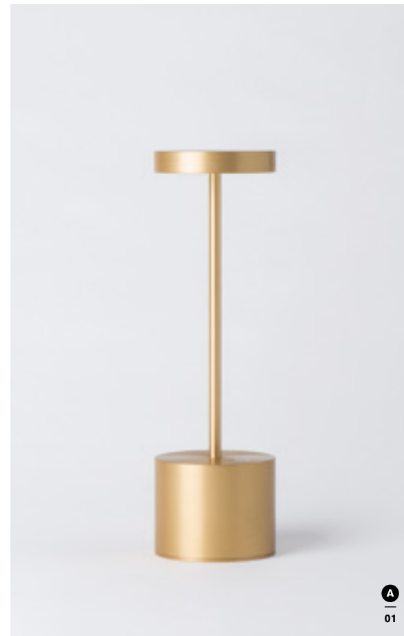
01/ LUXC-WA21C2 : OR / GOLD • 02/ LUXC-WA21N2 : NOIR / BLACK • 03/ LUXC-WA21B2 : BLANC / WHITE