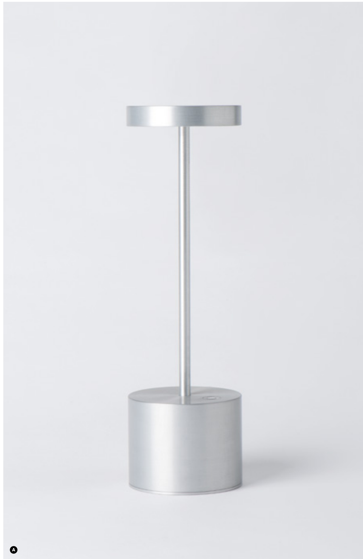
LUXC-WA21A2 : ARGENT / SILVER