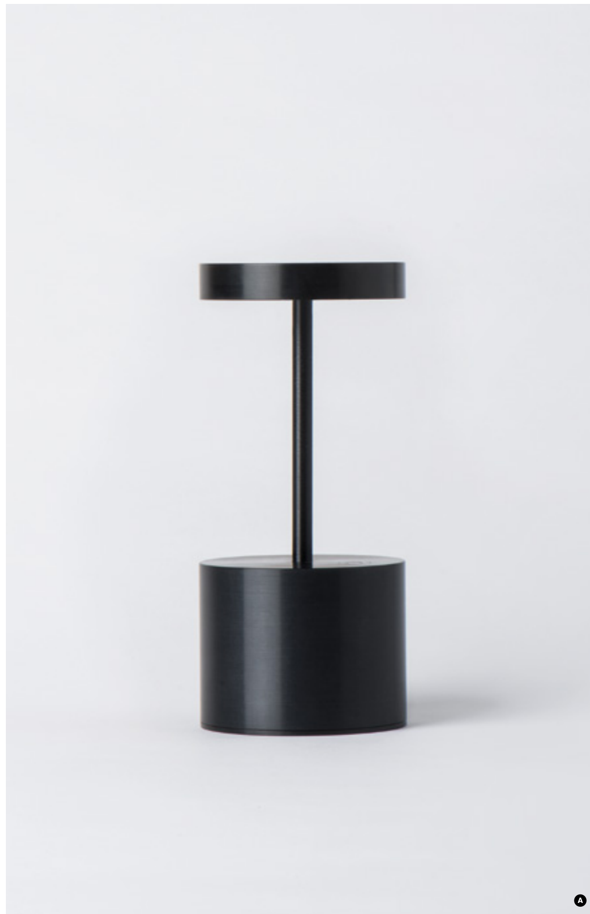
LUXC-WA31N2 : NOIR / BLACK