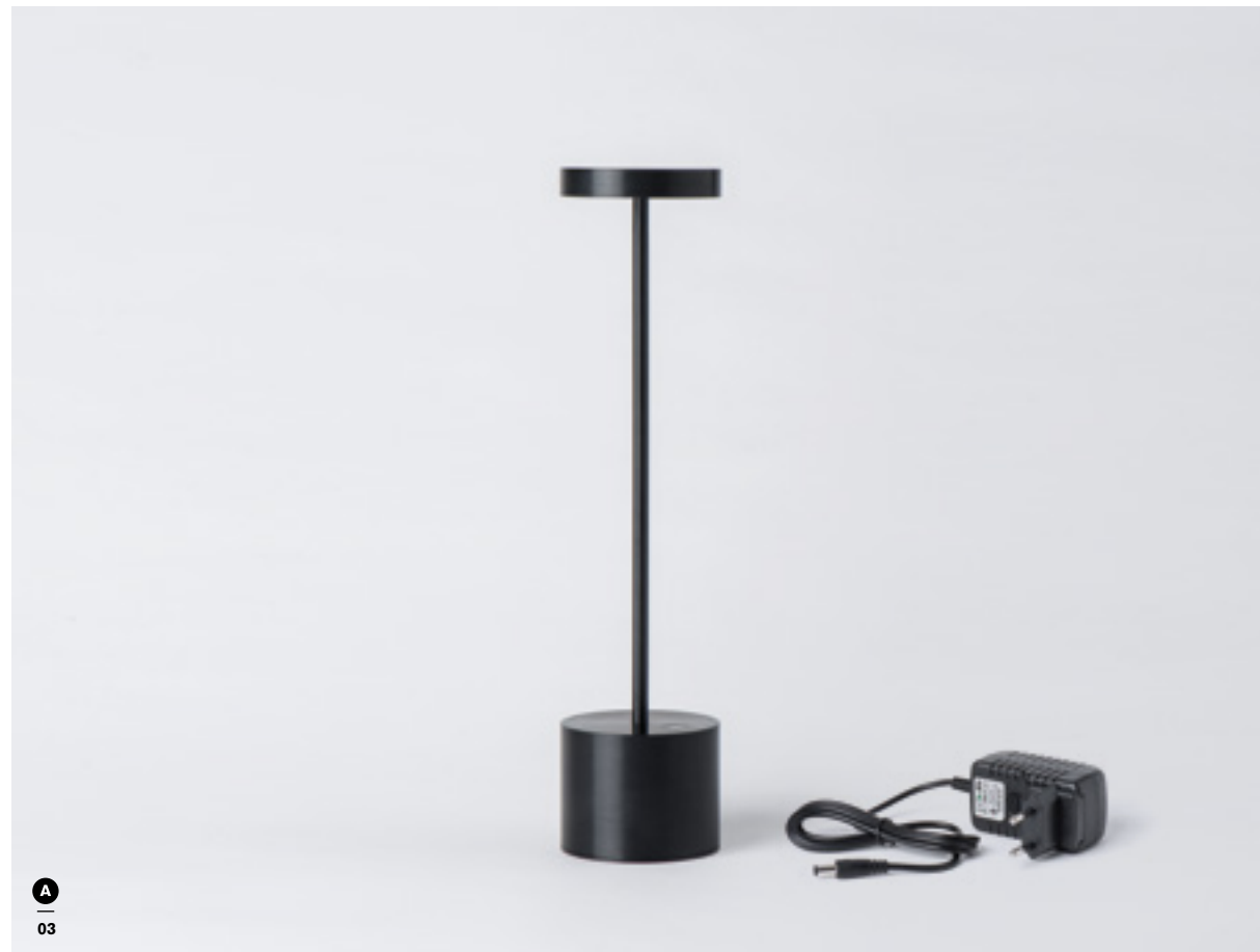
01/ LUXC-WA11B2 : BLANC / WHITE • 02/ LUXC-WA11A2 : ARGENT / SILVER • 03/ LUXC-WA11N2 : NOIR / BLACK