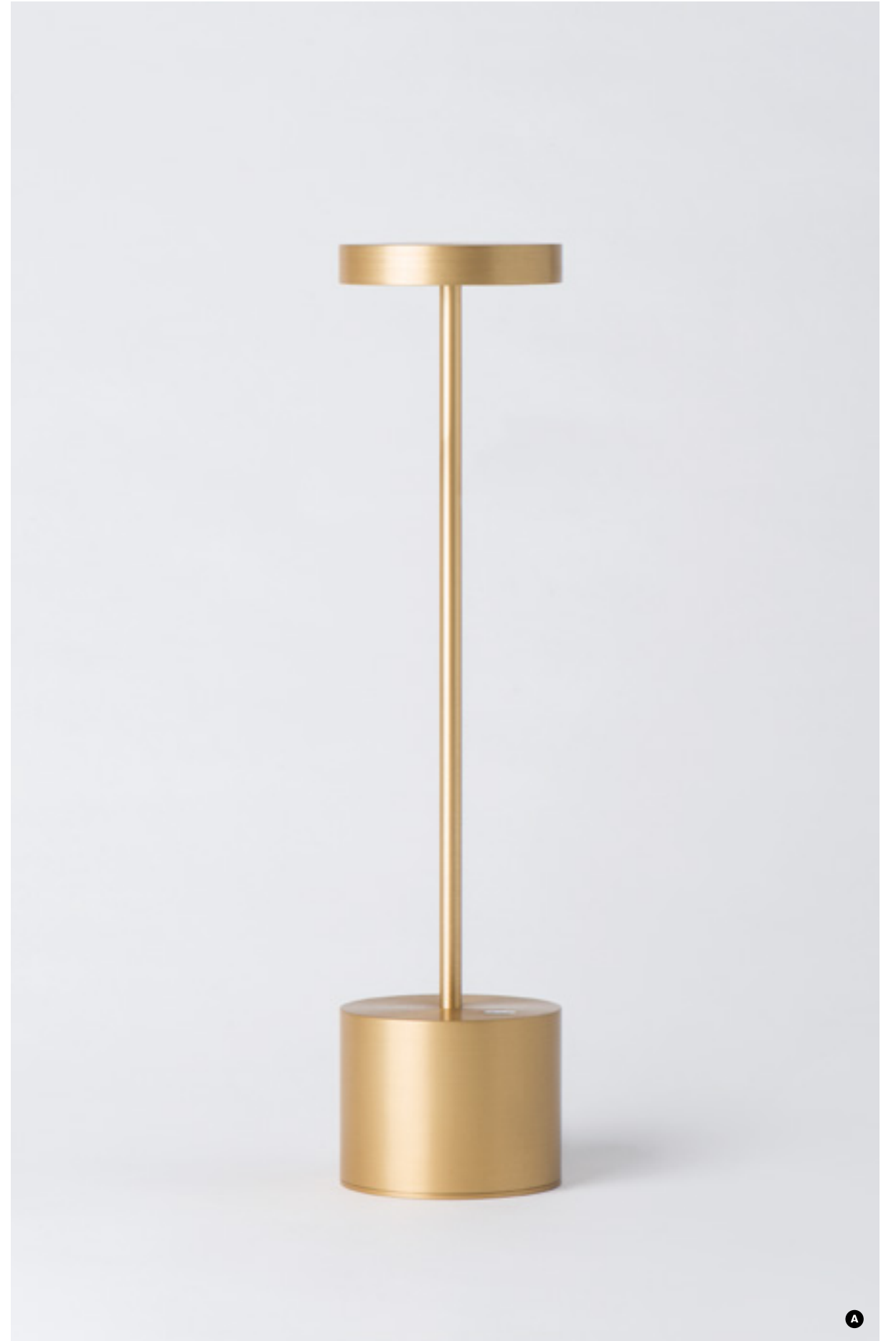
LUXC-WA11C2 : OR / GOLD